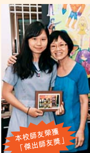
本校師友榮獲「傑出師友獎」

我們明白每一位學生都有不同程度的學習需要，因此，本校為學生提供全面的學習支援包括初中英文科和數學科採用按能力分組小班教學，並設有英文和數學功課輔導班、新來港學童英文班、高中英文拔尖班及課後英文說話班、高中DSE讀書技巧班、校本言語治療服務等，以照顧每一位學生的個別學習需要。此外，透過「良師友生」計劃，學校為安排每位中一學生配對一位老師，作為成長導師，在生活適應和學業上的同行者，陪伴學生成長。